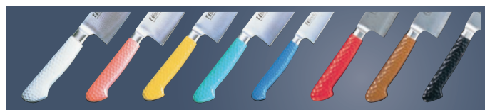
ホワイト ピンク イエロー グリーン ブルー レッド ブラウン ブラック

※「無機系抗菌剤」を標準仕様として配合しています。衛生管理の面において、清潔に安心してご使用いただけます。食材による変色はありません。